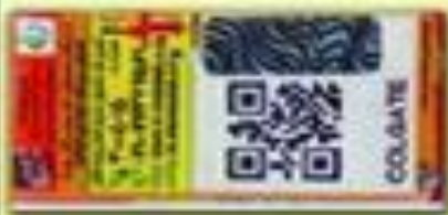
برجسب تقلبی و نامعتبر